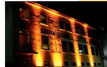
Genießen Sie unvergessliche Zeiten im schönen Würzburg und im Hotel Alter Kranen