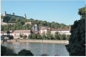
Der Blick aus dem Hotel auf die Festung ist immer ein Genuss.