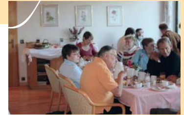
Umfangreiches Frühstück mit traumhaften Blick auf die Festung Marienberg

In direkter Umgebung finden Sie viele unterschiedliche Möglichkeiten für kulturelle und kulinarische Aktivitäten in und um Würzburg. Wir empfehlen den Besuch der Festung Marienberg. Dort ist im Mainfränkischen Museum eine einzigartige Riemenschneidersammlung zu sehen. Ein besonderes Erlebnis ist die fürstbischöfliche Residenz, das bekannteste Bauwerk von Balthasar Neumann. Die berühmten Weingüter, Julius-Spital, Bürgerspital und Hofkellerei laden ein zur Einkehr. Im nahegelegenen „Stachel“ haben schon Florian Geyer und seine Mitstreiter gezecht.