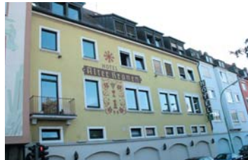
Blick auf die Hotelfront, direkt vom Mainufer.