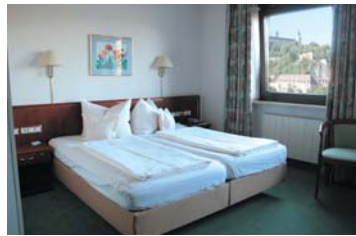
Sie schlafen trotz Lage im Zentrum sehr ruhig - wenn Sie nicht das Würzburger Nachtleben genießen