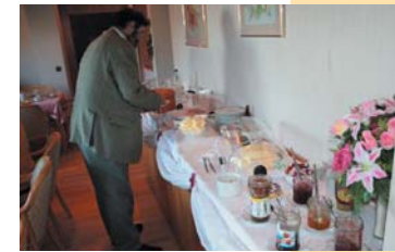
Genießen Sie das abwechslungsreiche Frühstücksbuffet