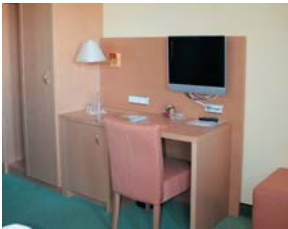
Alle Zimmer sind modern und komfortabel eingerichtet.