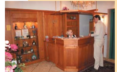
Einen angenehmen Aufenthalt ermöglicht Ihnen unser kompetent geschultes Personal